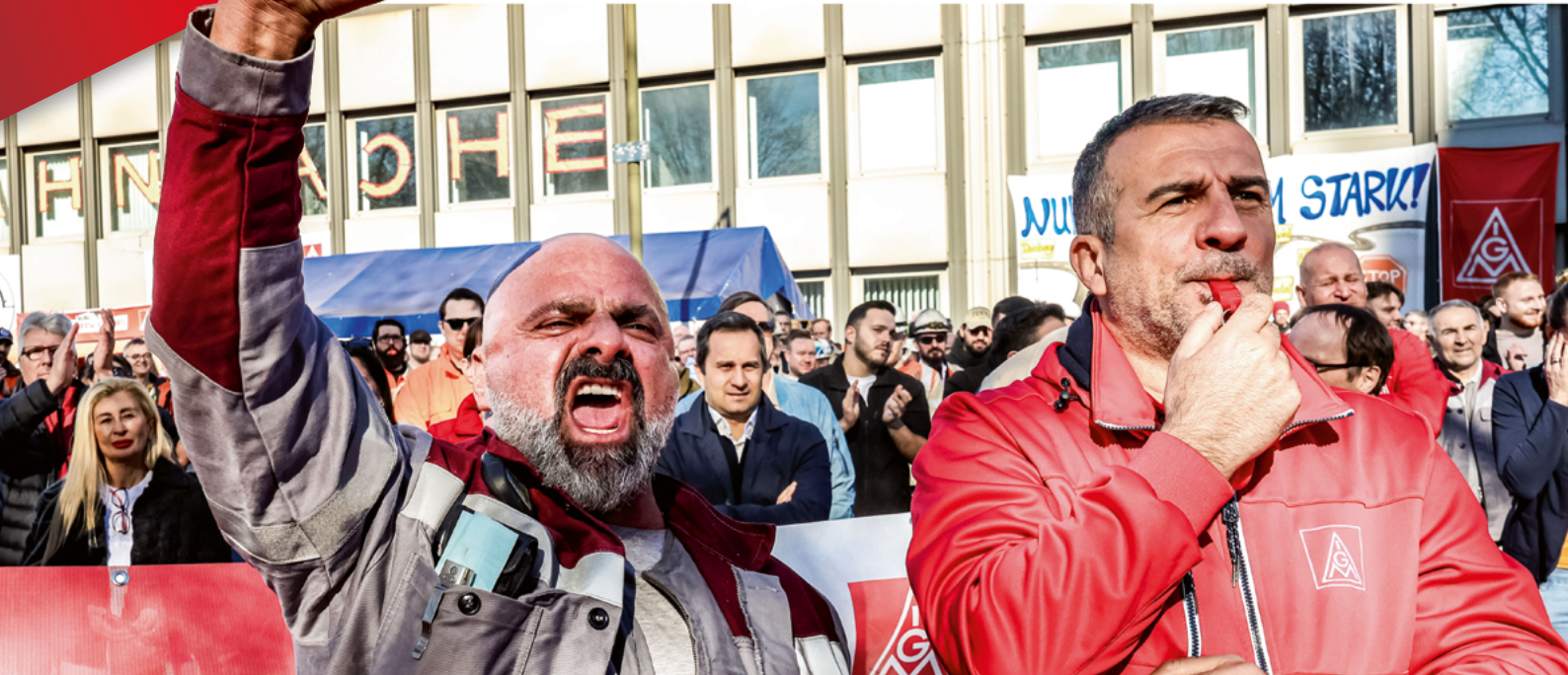
Demonstration vor der TKSE-Zentrale in Duisburg im April 2025. Die Beschäftigten verlangen zu Recht mehr als eine reine Streichorgie.